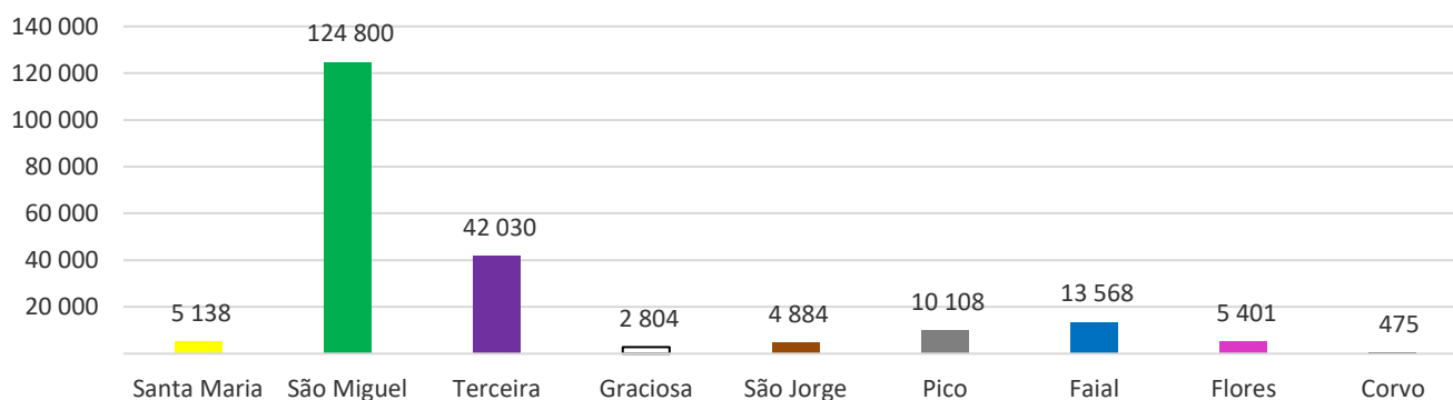
Figura 3 – Desembarque de passageiros, por ilha, no mês de referência.

Por ilha, as que apresentam variação homóloga mensal positiva no desembarque de passageiros são: São Miguel (+14,6%), Terceira (+12,9%), Santa Maria (+10,1%), São Jorge (+9,5%), Flores (+9,4%), Pico (+7,7%) e Faial (+4,7%). As ilhas que apresentam variação homóloga mensal negativa são: Graciosa (-4,0%) e Corvo (-1,2%).